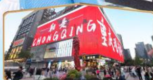
ถนนคนเดินถวณอันเฉียว