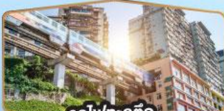
รถไฟฟ้า-สุตึก