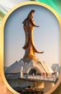
เจ้าแม่กวนอิมริบทะเล