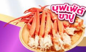
บุฟเฟ่ต์ ซาซิมิ