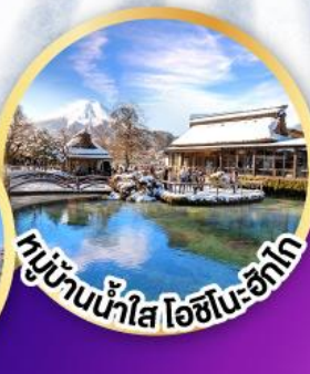
หมู่บ้านน้ำใส ไอชิโนะ-ซึกโก