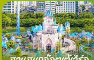
สวนสนุกลิตต์เวิร์ล Lotte 'adventure world