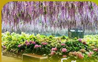
สวนนกเปาเม็ย