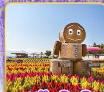
สวนซึกิไซโนะโอะกะ