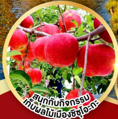
สนุกกับกิจกรรม เก็บผลไม้เมืองชิซุโอกะ