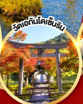
วัดเอกันโตเซ็นริน