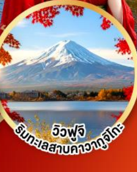
วิวฟูจิ ริมทะเลสาบคาวากูจิโกะ