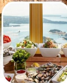
SKYFEAST BUFFET SYDNEY TOWER