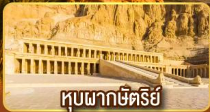
หุบผากษัตริย์