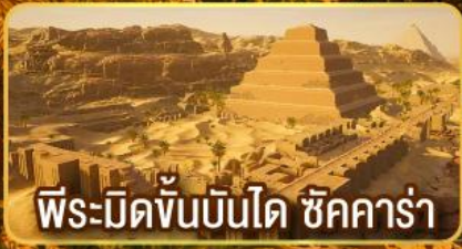
พีระมิดขั้นบันได ชิคคาร์่า