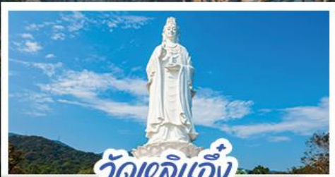
วัดเลิอัน