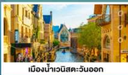
เมืองน้ำเวนิสตะวันออก