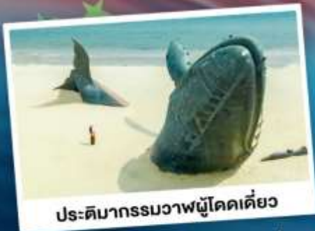
ประติมากรรมวาฬโคดเคียว