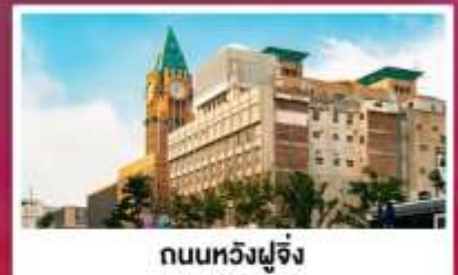
ถนนหวังฝูจิ่ง