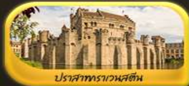
ปราสาทราเวนสตีน