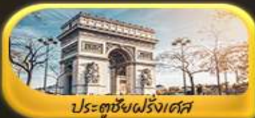
ประตูชัยฝรั่งเศส

พิเศษ!! ล่องเรือแม่น้ำแซนชมเมือง โดย บาโด มุช