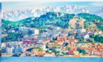
หมู่บ้านชาวประมงซาจื่อโข่ว