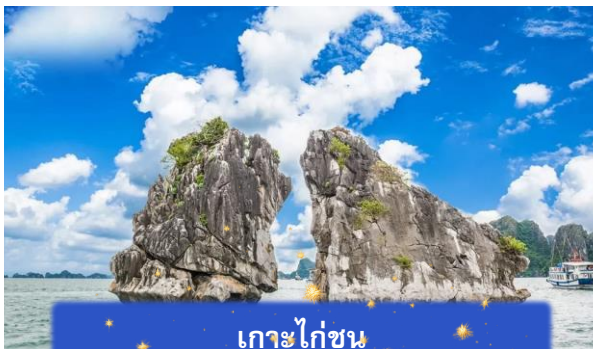
เกาะไก่ชน

เที่ยง บริการอาหารกลางวัน ณ ภัตตาคาร พิเศษ ... เมนูซีฟู้ดบนเรือ