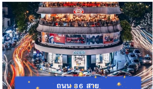
ถนน 36 สาย