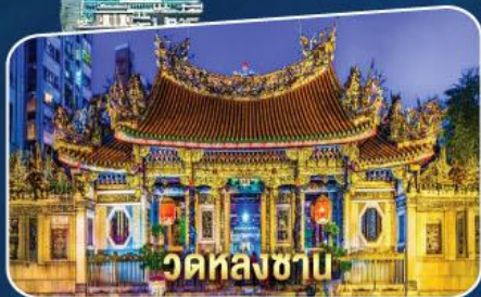
วัดหลงซาบ