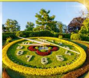
นาฬิกาดอกไม้เมืองจันทบุรี